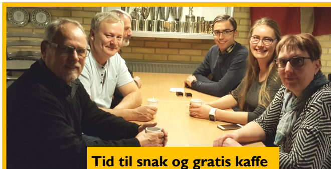
Tid til snak og gratis kaffe

Hvis I vil undgå ventetid, så mød venligst op til den angivne skydetid