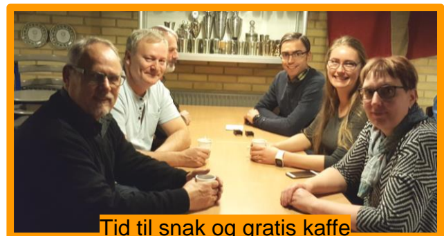
Tid til snak og gratis kaffe

Hvis I vil undgå ventetid, så mød venligst op til den angivne skydetid